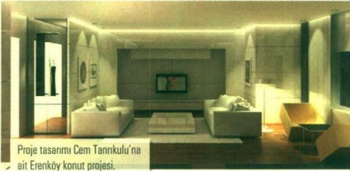
Proje tasarımı Cem Tanrıkulu'na ait Erenköy konut projesi.