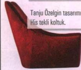
Tanju Özelgin tasarımı His tekli koltuk.