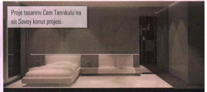
Proje tasarımı Cem Tannkulu'na ait Savoy konut projesi.