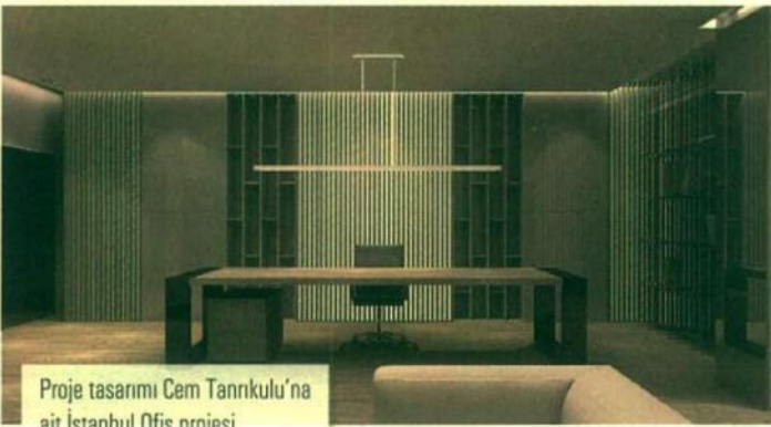
Proje tasarımı Cem Tanrıkulu'na ait İstanbul Ofis projesi.