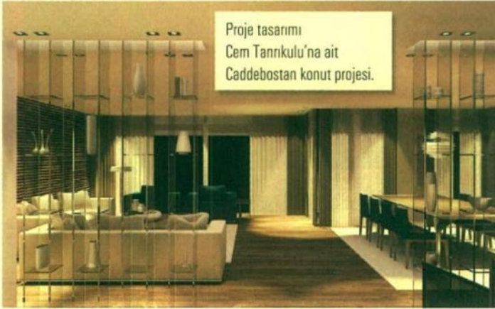
Proje tasarımı Cem Tanrıkulu'na ait Caddebostan konut projesi.

Modern dekorasyon tarzıyla öne çıkan Birim, sade çizgileri ve fonksiyonel tasarımlarıyla sıradışı mekânlar yaratıyor.