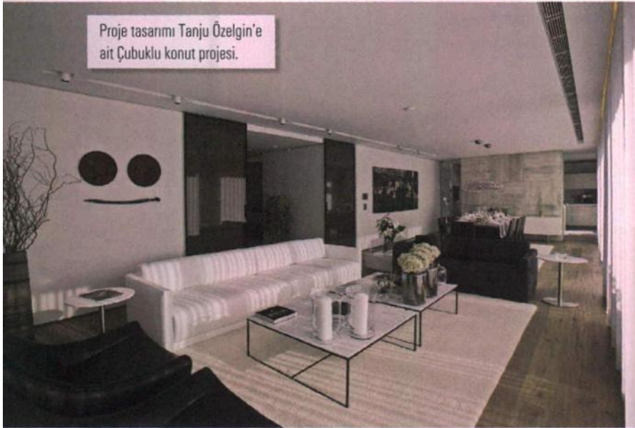
Proje tasarımı Tanju Özelgin'e ait Çubuklu konut projesi.